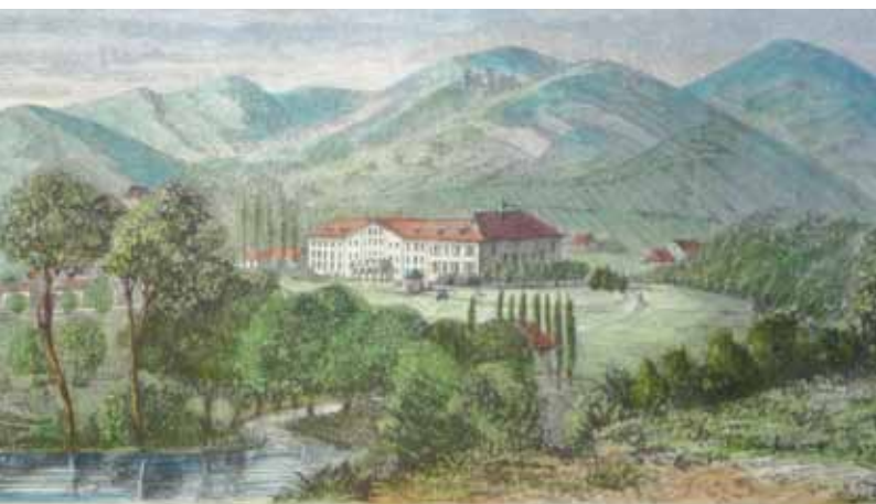
BAINS DE LA HOUB (grand-duché de Bade, près Baden-Baden).