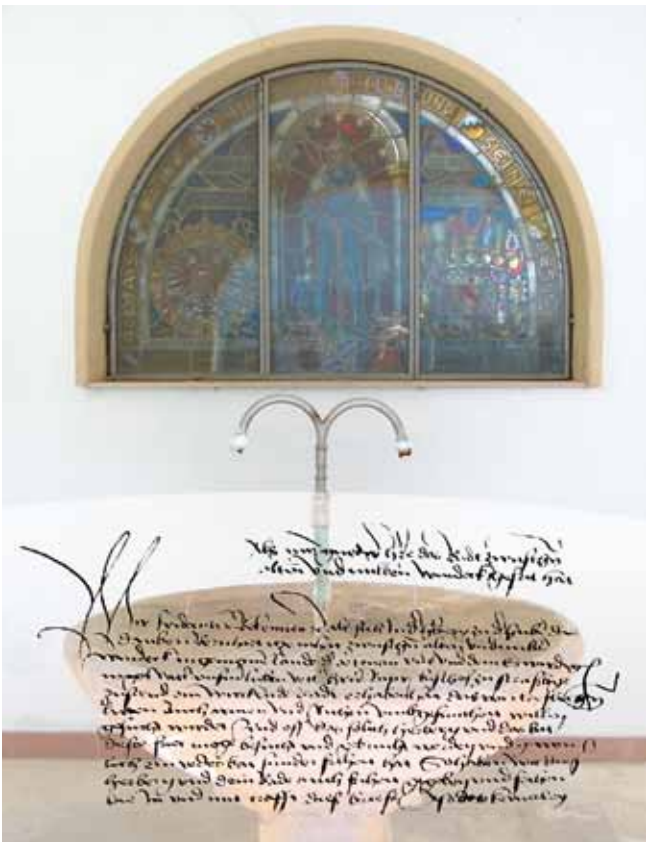
Das Huberbad erhielt 1475 Deutschlands erste Badeordnung

Diese Quelle hat vierhundert Jahre lang die Geschichte der Hub geprägt. Denn schon 1475 stellt Kurfürst Friedrich I. von der Pfalz (der im Glasfenster dargestellt ist) für die Hub, die damals pfälzisches Lehen war, ein Badeprivileg aus, das strenge Regelungen für den Badbetrieb enthielt. Diese Badeordnung von 1475 für das Bad Hub in der Ortenau gilt als eine der ersten Badordnungen in Deutschland.