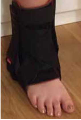
Patient mit Schiene