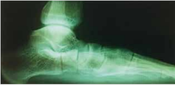
Durchgetretener Plattfuß vor Korrektur