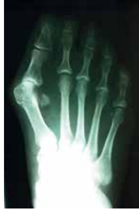
Überlange Mittelfußköpfe 2 und 3