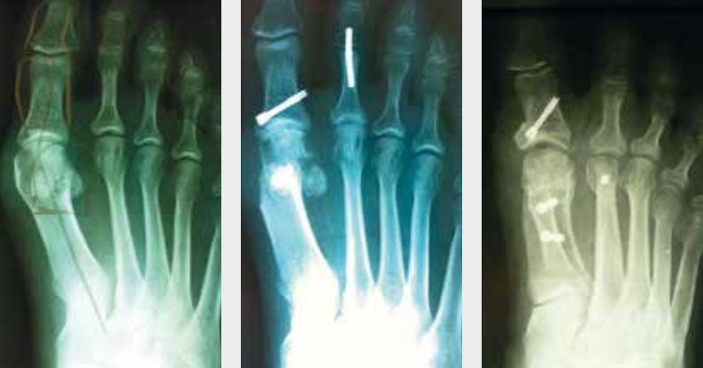
Typischer Hallux valgus