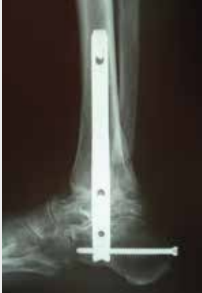
Versteifung mit einem Titan Nagel