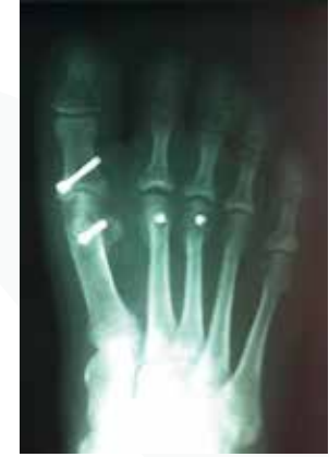
Rückversetzung und Fixation mit Titanschrauben nach Weil