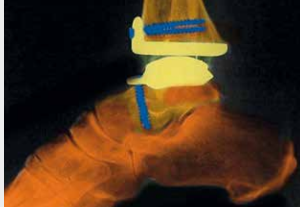
Versorgung mit einer Prothese des oberen Sprunggelenks und Versteifung des unteren Sprunggelenks

Zur Behandlung muss man oberes und unteres Sprunggelenk gesondert betrachten. Wenn konservative Maßnahmen, wie Physiotherapie, Bandagen, Entlastung, Spritzkuren oder Medikamente keine Besserung der Beschwerden bewirken, sollte eine Operation in Erwägung gezogen werden.