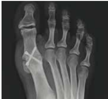
Versteifung des Großzehengrundgelenks