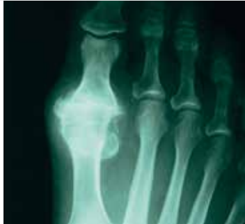
Aufbrauch des Gelenkspaltes