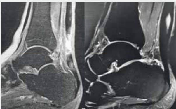
Achillessehnenriss (links), chronische Achillessehnenreizung mit Einblutungen (rechts)