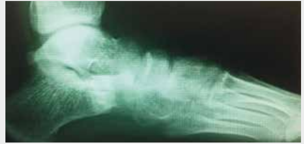
Nach Korrektur mit Calcaneusverlängerung