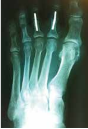
Einsatz kleiner Titanimplantate