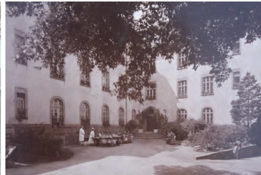
Das heutige „Haus am Park“ – Ansicht des Innenhofs des neuen Frauenbaus, um 1930.