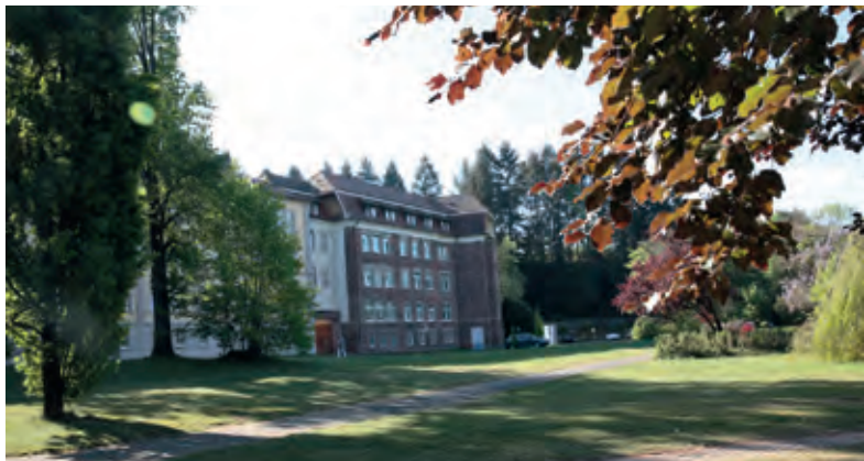
Das Klinikum Mittelbaden Hub, Pflege- und Betreuungszentrum, ein einzigartiges, in idyllischer Landschaft gelegenes Pflegedorf.