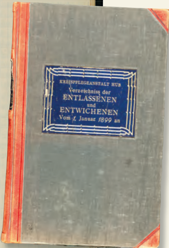
„Verzeichnis der Entlassenen und Entwichenen vom 1. Januar 1899 an“, Kreisarchiv Rastatt, 1/HUB B1