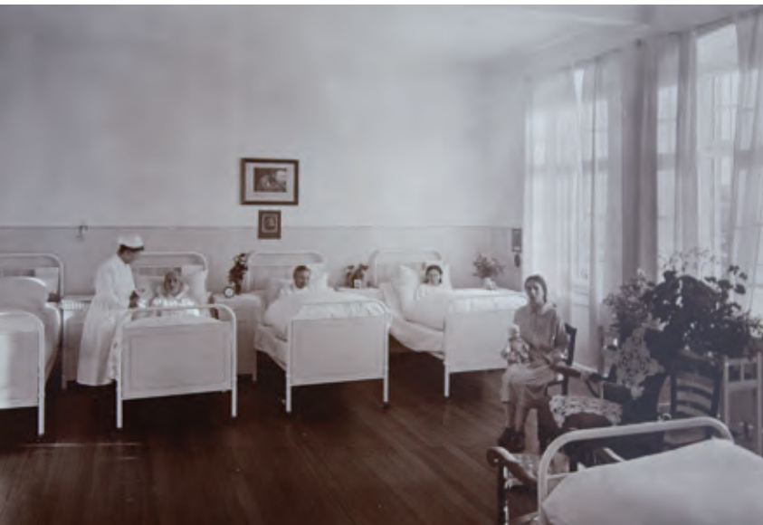
Haus am Park, Frauensaal, um 1930.