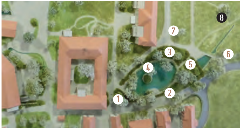
1-7 Standorte „Wider das Vergessen“ / 8 Standort Maria Assunta