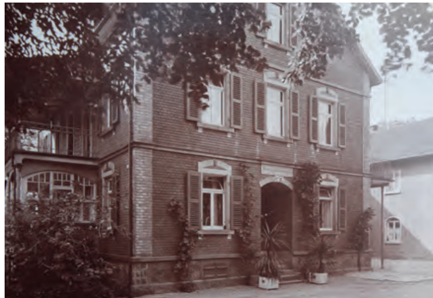
Lindenhof, um 1930.